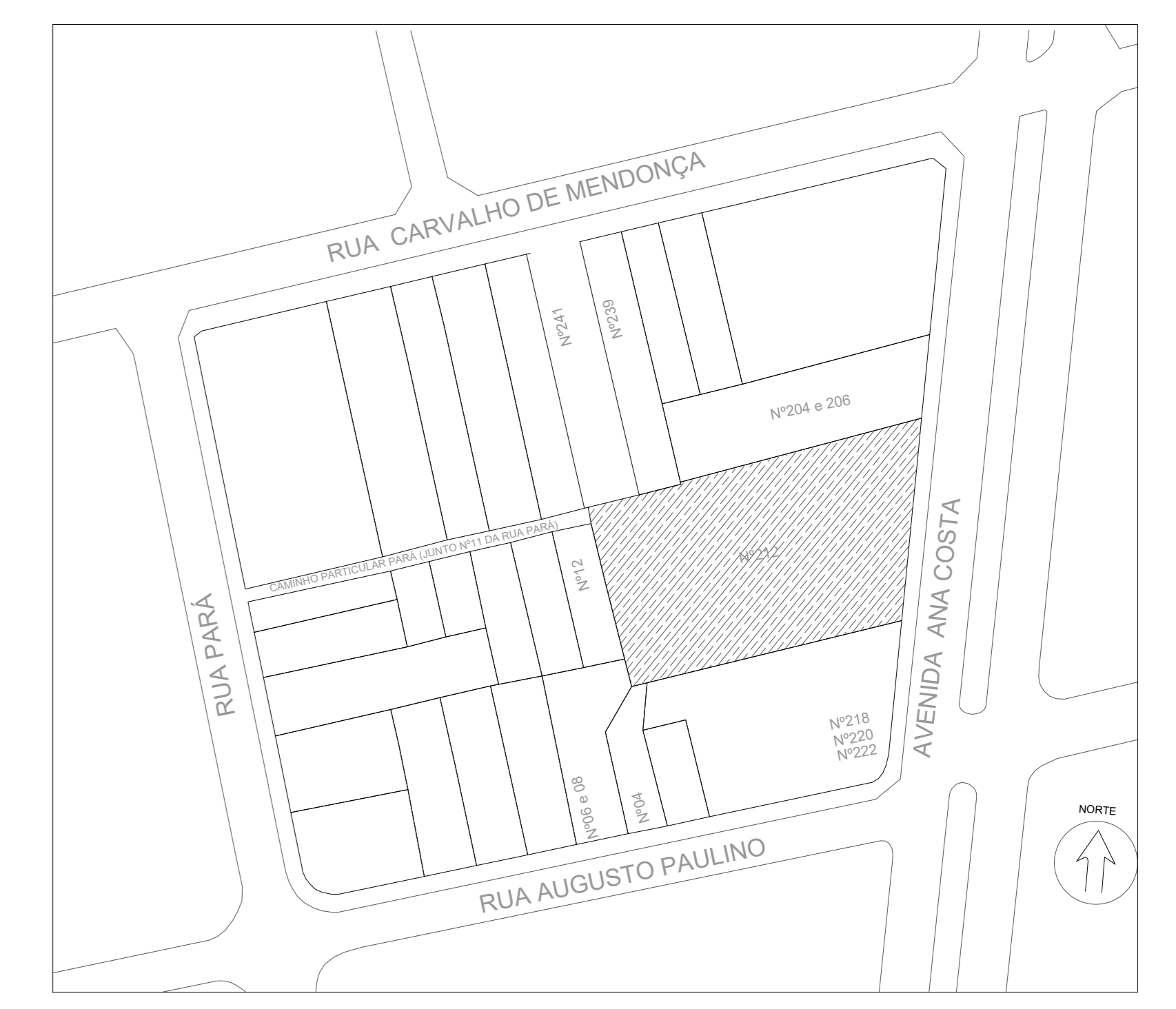
3 LOCALIZAÇÃO TERRENO 1:1000