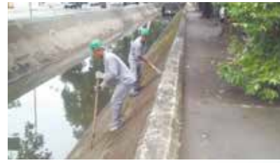
Manutenção do talude do Canal 3