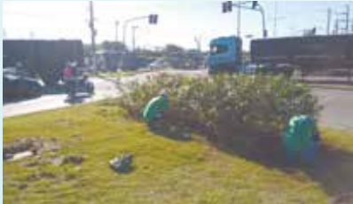
Limpeza dos jardins da entrada da Cidade e retirada de lixo na Av. Martins Fontes - Saboó