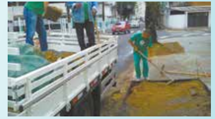
Reparo em calçada danificada por raízes de árvores na Rua Pedro Arbues - Ponta da Praia