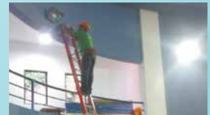
Troca de refletores no Centro Esportivo São Bento