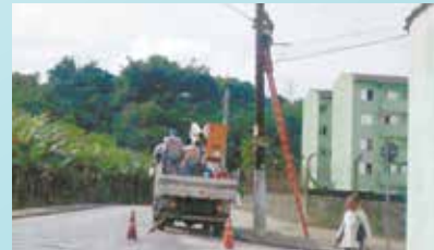
Reparo em instalações elétricas - Av. Brasil - Morro Nova Cintra