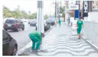
Pintura de guias e postes na Av. Vicente de Carvalho - Gonzaga