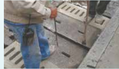
Conserto na Rua XV de Novembro - Centro