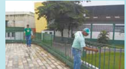
Pintura do gradil no entorno da piscina do M. Nascimento Jr - Bom Retiro