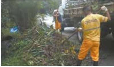
Retirada e limpeza do Cata Treco nas ruas do bairro do Caruara