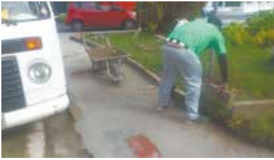
Manutenção da Praça Gomide Ribeiro - Embaré