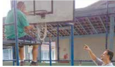
Reposição da tabela de basquete da quadra da UME Judoca Ricardo Sampaio - Caruara