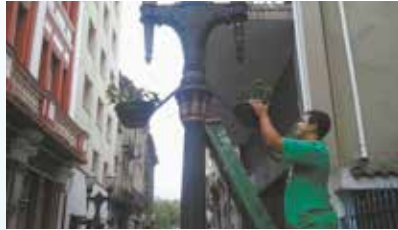
Colocação de flores no bulevar da Rua XV de Novembro - Centro