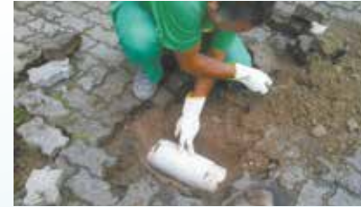
Conserto do piso do estacionamento do Arena Santos - Vila Mathias