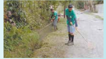
Roçada de mato na Rua São José e Rua Hum - Caruara