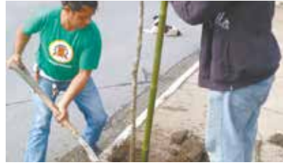
Replântio de 6 mudas e colocação de 9 grades de proteção na Av. Andrade Soares - Caruara