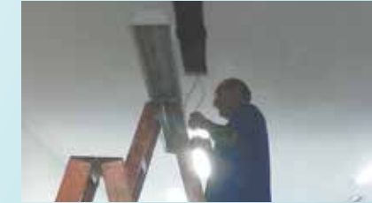
Troca de lâmpadas na Guarda Municipal da Praça dos Andradas - Centro