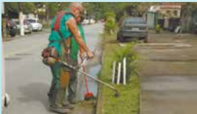
Corte de grama na Av. Santista - Nova Cintra