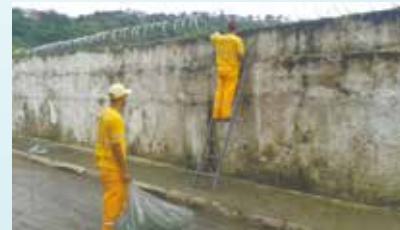
Limpeza de mato entre as concertinas do Cemitério do Filosofia - Saboó