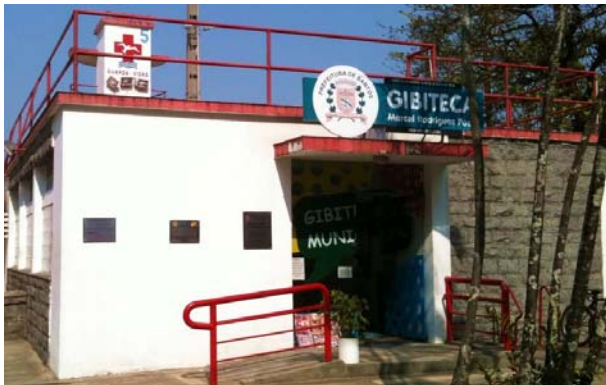
Gibiteca Municipal Marcel Rodrigues Paes