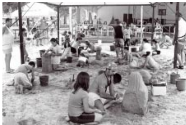
Oficina de Escultura em Areia

Bailes na Praia - sextas, sábados, domingos e feriados, das 19 às 23 horas, nas cinco tendas da orla, orquestras e grupos musicais irão colocar todo mundo para dançar, com o melhor da música nacional e internacional.