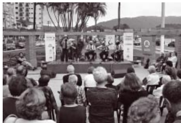
Chorinho no Aquário