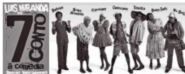
7 Conto – A Comédia, dias 12 e 13, no Municipal