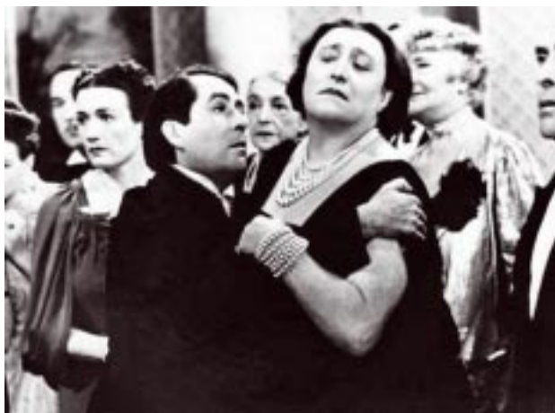
A Regra do Jogo