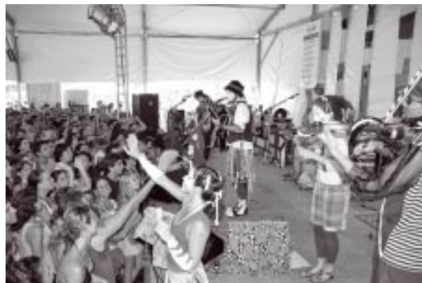
Espectáculos de Música